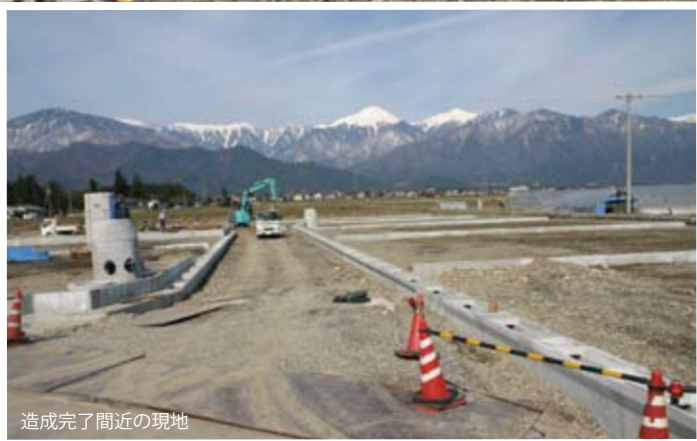
造成完了間近の現地