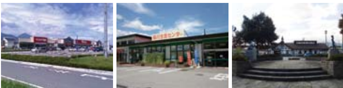
ベイスシア掘金店約 1.3km JAあづみ生活センター約 1.8km JR豊科駅約 2.8km

物件概要 ■所在地 / 安曇野市堀金烏川 4561 の内 ■区画数 / 全 11 区画 ■都市計画 / 未線引区域 ■用途地域 / 無指定 ■地目 / 宅地 (公簿) ■建ぺい率 / 60% ■容積率 / 100% ■高さ制限 / 10m ■水道 / 公営水道 ■電気 / 中部電力 ■ガス / 個別プロパン ■下水 / 公共下水道 ■開発行為 / 23 松地建第 33-3 号 / 安曇野市開発事業承認堀金承認 23 第 08 号 ■農地転用 23 松地農第 5 号 207 許可 / 安曇野市景観条例届出 ■市条例による田園環境区域内 (隣地 1m、農地 2m、道路 2m 後退有) 上水道加入金、下水道受益者負担金別途要 ■交通 / JR 大糸線「豊科」駅より約 2.8km ■通学区 / 堀金小学校 (約 2.7km)・堀金中学校 (約 2.3km) ■引渡 / 相談