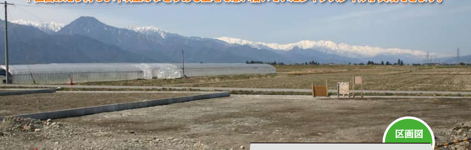
現地よりアルプスを望む。

田園地帯の周りが開けた全 11 区画の分譲地、常念・北アルプスの景色眺望良好! 1 区画あたり約 90 坪以上のゆとりある土地で思い描いていたライフスタイルが実現できます。